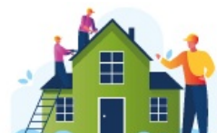
Programme "Rénovation des Bâtiments Publics"