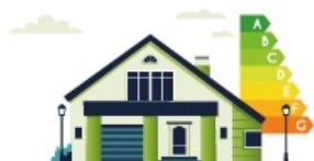
Programme "Audit Énergétique et Diagnostic

L'objectif des programmes est de mettre à disposition et de financer des outils d'aide à la décision pour les collectivités souhaitant développer des projets de rénovation énergétique des bâtiments publics dans 2 domaines : l'efficacité énergétique des bâtiments publics et la substitution d'énergies fossiles par des systèmes énergétiques performants et bas carbone.