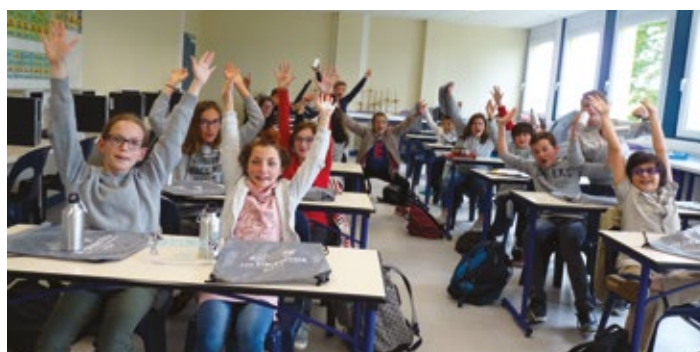
La classe de 6 ème A du Collège Voltaire d'Airvault.