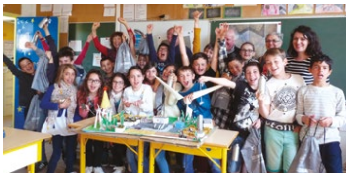
La classe de CM2 de l'école publique Belle Étoile de Coulonges-sur-l'Autize.