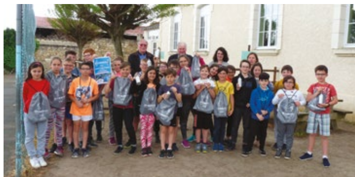
La classe de CM1 de l'école publique de Brion-près-Thouet